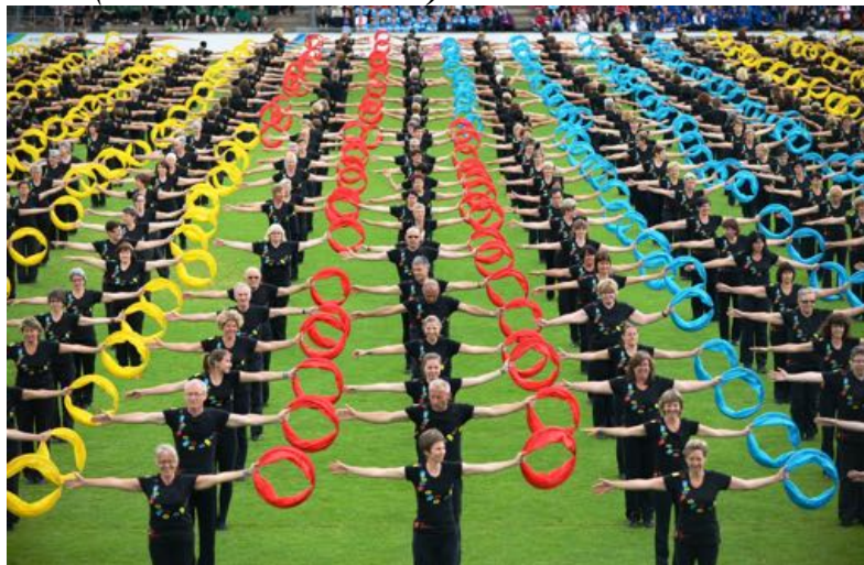
Exercices généraux (Fête Fédérale de 2013).