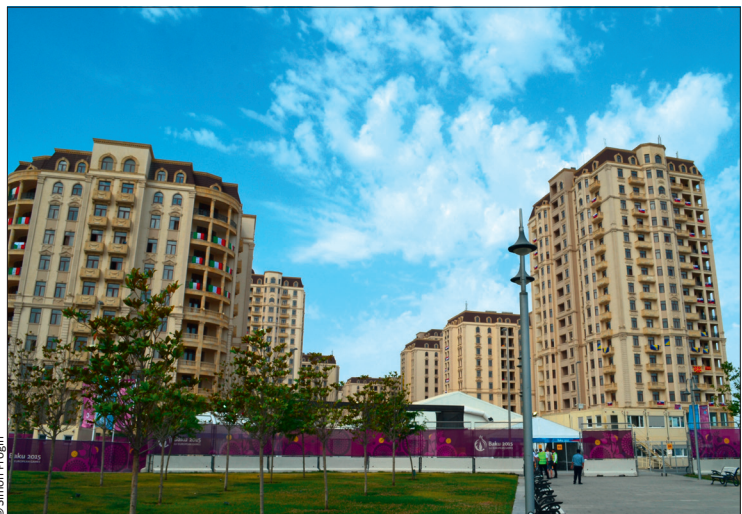
Avec ses treize tours de 1042 appartements (7500 lits), la résidence des sportifs ressemble plus à une mini-cité dans Bakou qu'à un village olympique.

Résultats et classements : www.stv-fsg.ch