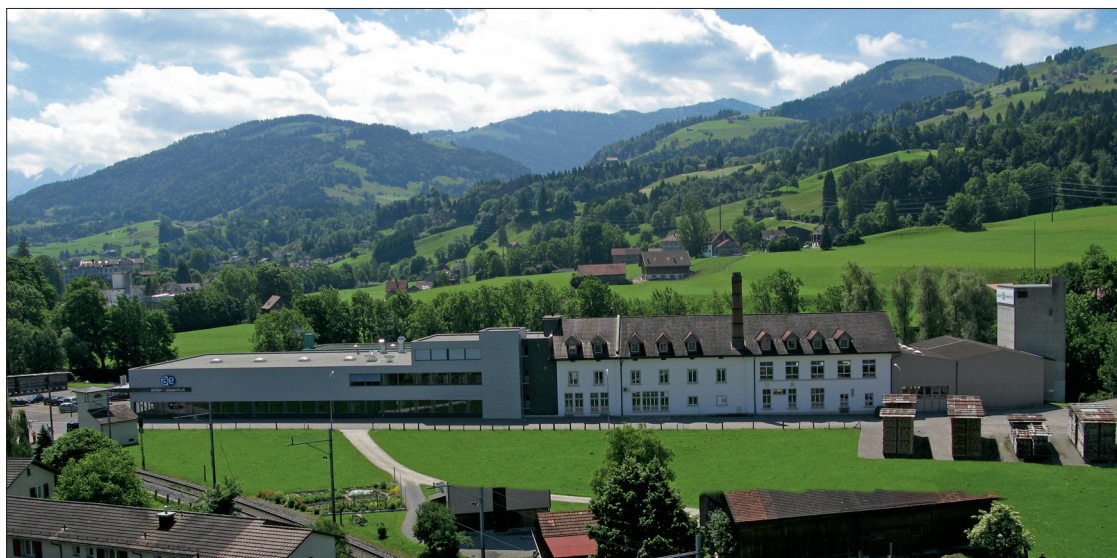
L'usine Alder + Eisenhut AG à Ebnat-Kappel, dans le Toggenbourg.

Il n'existe pas une salle de gymnastique suisse ne possédant pas au moins un engin estampillé Alder + Eisenhut ! Mais qui se cache derrière cette entreprise ?