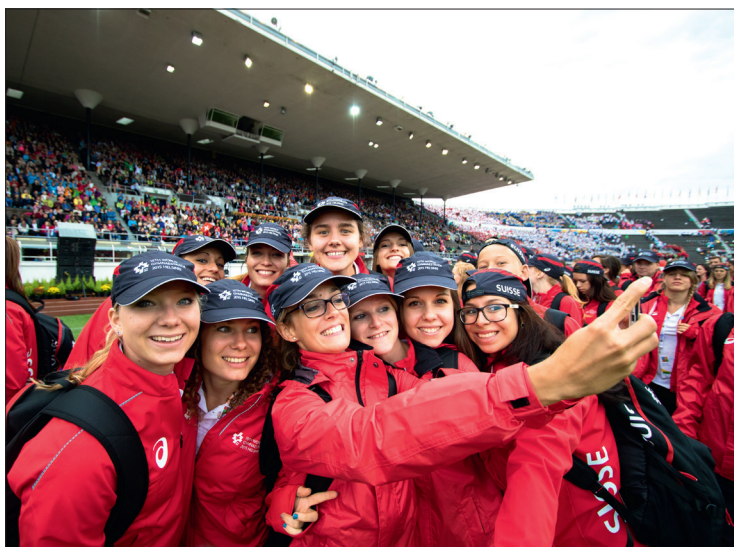
Les selfies n'ont pas manqué pendant la cérémonie d'ouverture.

Jeudi 16 juillet, ultime représentation. Signe aussi que tout ce qui a été préparé, vécu, etc., prendra (Suite en page 20)