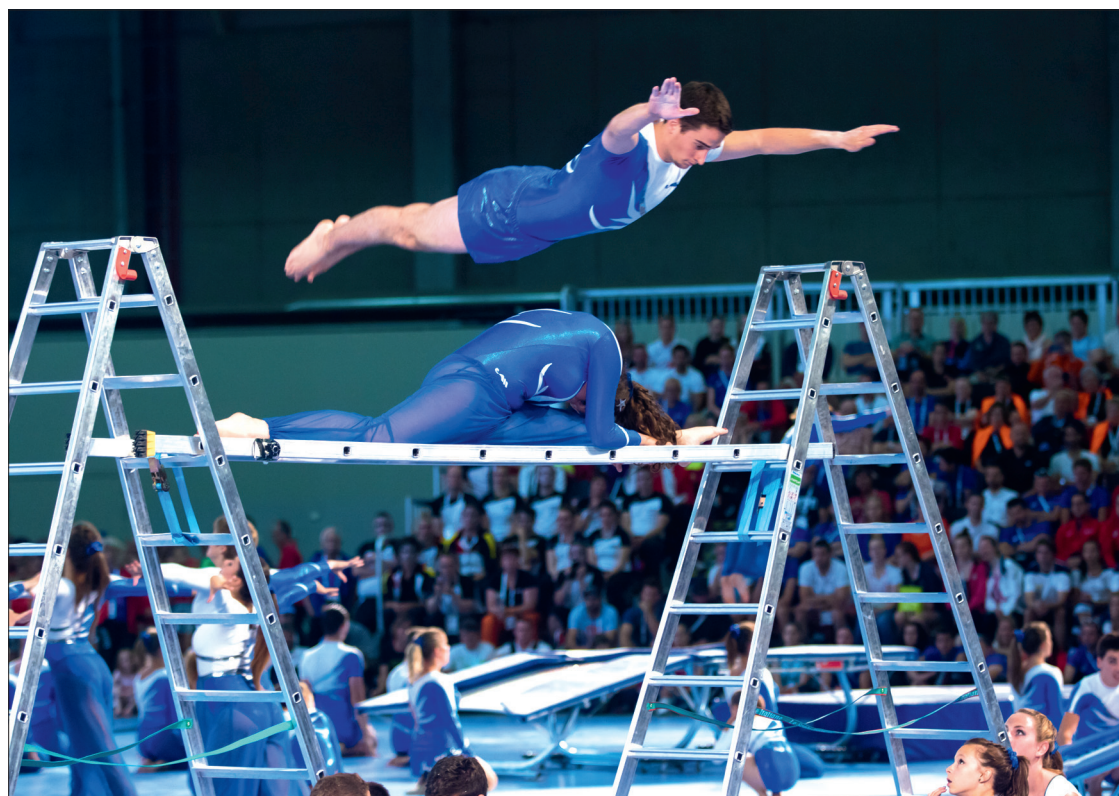
Ce qu'on peut aussi faire avec des échelles.