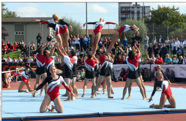
Yverdon Amis-Gymnastes au sol.

L'objectif de cette compétition est de participer, certes, mais surtout de convoiter le titre de champion suisse ! Composés d'au moins six gymnastes d'une société, les groupes se défilent dans le cadre de concours de gymnastique et de gymnastique aux agrès. Le titre de champion de la discipline est décerné pour autant que cinq