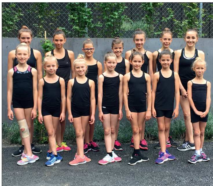
Les quatorze gymnastes du Centre cantonal.

Sous l'insoutenable chaleur des salles chambériennes, quatorze gymnastes vaudoises, accompagnées de leurs quatre entraîneurs (dont une qui a jugé), se sont mesurées au niveau international de la compétition locale.