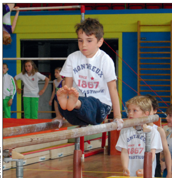
Jeune Montreusien à l'échauffement.