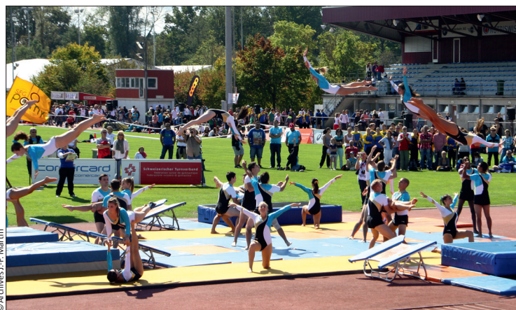
Pomy à la combinaison d'engins