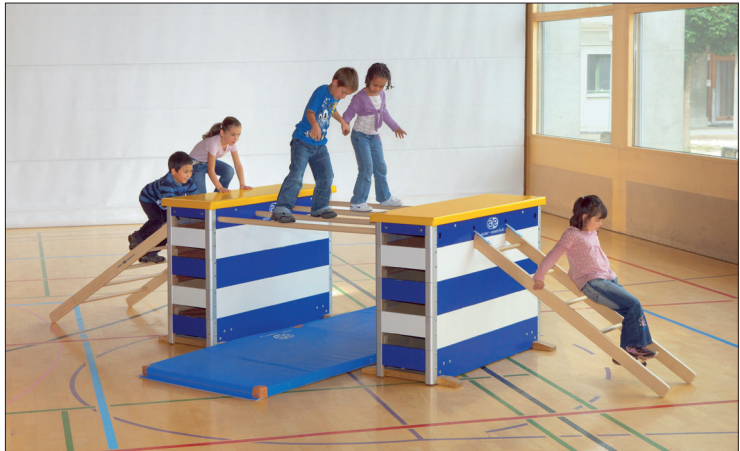
Des engins bien connus des élèves des écoles et des gymnastes.

Il est difficile de choisir une seule « perle », il s'agit plutôt d'un « collier de perles ». Pour les produits issus de notre propre fabrication, nous nous efforçons de respecter la singularité suisse et garantissons un bon rapport qualité-prix.