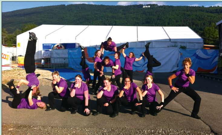
Team aérobic Corcelles-le-Jorat.