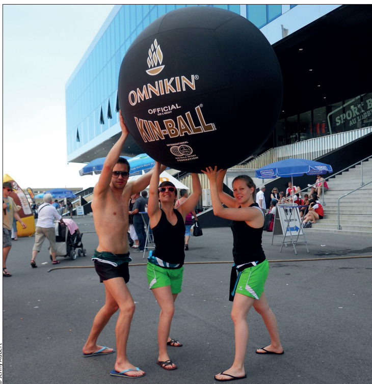
Prise de contact avec le ballon lors de la Fête romande à Neuchâtel.